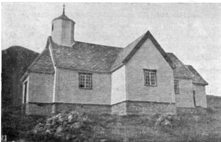
Fig. 3. Torsken kirke.

Taket var „meget fordærvet som storlig behøver omflidning". Kirken hadde ingen anden indtægt end „den ringe tiende som falder af dette lidet sogn" og blev av kirkestolen fremvist av hr. Ursin og var revidert i 1764 av provst Falster. Kirkens beholdning var da 44 rd. I 1769 var dens beholdning 110 rd. 1 mk. 4 sk., hvilke penger blev fremvist og skulde staa i forvaring hos presten og brukes til kirkens reparation som var alvorlig nødvendig. Regn-