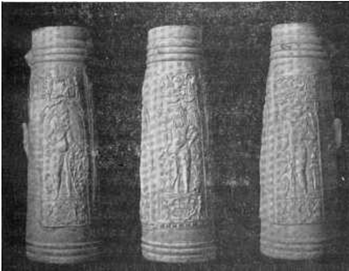
Fig. 2. Krus fra Medfjordens kirke. (Set fra 3 sider).

met bæger av graahvitt terrakotta. Det er smukt ornert med tre basrelieffigurer i tre felter. Til venstre en mandlig figur, omgit av indskriften Hectot van Troen. Under figuren et skjold der holdes av to staaende løver. Over figuren et stilisert hode omgit av to smaa menneskefigurer. (Fig. 2).