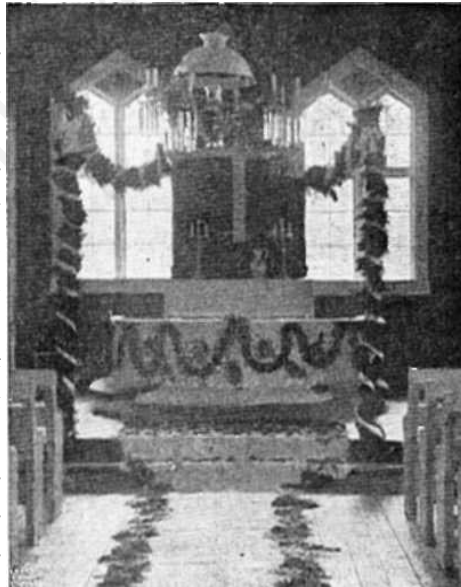
Fig. 5. Interiør fra Sands nye kirke.