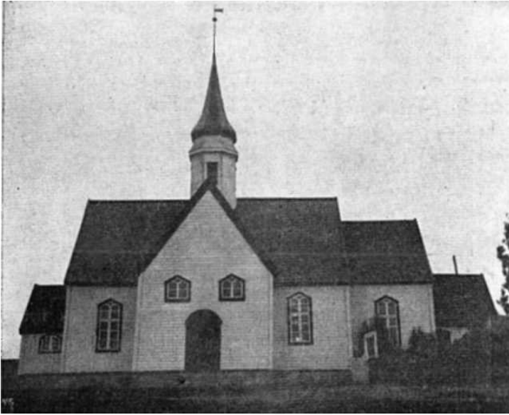
Fig. 6. Bjarkøy kirke opført 1765 paa Sand og flyttet 1886.

Kirken var da en nylig opbygget korskirke av træ med nyt taarn, tegltak, sakristi og vaabenhtis, god indredning med gulv og stoler, men manglet endda loft samt en liten del av tegltaket paa vaabenliuset. Kirken kaldes „anselig og vel bygget". Den hadde to smaa gode klokker i taarnet, en ganske sirlig altertavle, som ti-