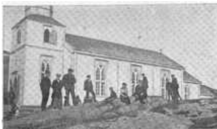
Fig. 1. Bergs kirke i Senjen.

Hr Hammer lot ogsaa erindre at naar Bergs kirke blir av ny opbygget, ønsket han at den blir sat paa et bekvemmere sted, som han navngav at være paa gaarden Skagland, et litet stykke her fra stedet, istestaar paa en bergklippe, hvor ingen kirkegaard kan være; men kirkegaarden maa være et langt stykke herfra.