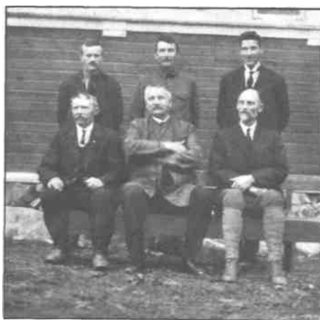
Bogkomiteen ved «Dølheim» paa Bakkehaug. Pinsedag 31. mai 1925.

Matklokker, som der ringes med til dagens forskjellige maaltider efter gammel skik, fandtes paa følgende gaarde: Solli, Moen (Johnsens), Fagerlidal, Brandskognes, Nymoen, Sandeggen, Kirkesnes osv. De gamle stuer paa Fosmo, Nergaard og Kongsli minder ogsaa om de gamle stuer fra Østerdalen. Maalselvdalens gamle aristokrati hadde hjemme paa disse gaardene, og den gamle rot skyter endnu friske skudd, om end i moderniserte former. Den gamle skik med matklokkerne bør bevares og klokkernes festlige klang tone længe over dalen, den fagre Maalselvdal med magt for kommende tider.