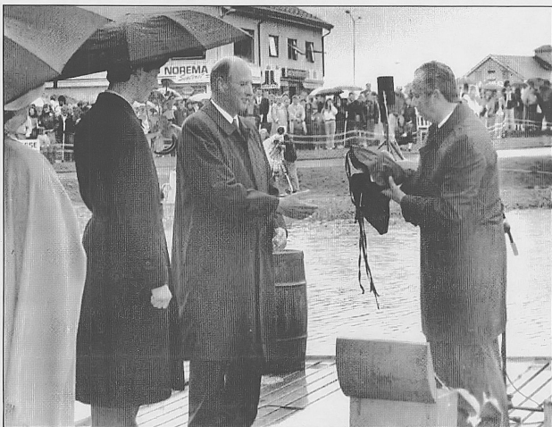
FIKK GAVER: Hjemmestrikkede sjøvotter brukt av fiskerne i gamle dager, hjemmesyddesydvest fra andre halvdel av 1800-tallet i lerret med impregnering var noe av det ordfører Arne Bergland ga kong Harald.