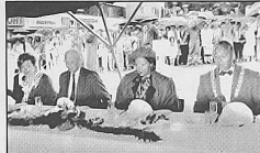
LUNSJ-RAPPORT: Fru ordfører, konge, dronning og ordfører på torg-lunsj. (Også TFs Tom R. Johansen var der, og rapporterer.)

Men så kaldt! I mellomtida hutret Café-ensemblet seg gjennom et parisisk 20- og 30-tallsrepertoar. Med valne finger. En prestasjon at de fikk det til i survaret. Og like imponert ble vi av kelnerne. Som bar og bar og ble våtere og våt-