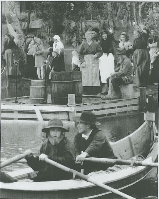
MED SJARM: De kongelige så ut til å like synet med flotte kyst-kulisser med naust og autentisk kledte syngende- og spillere som kom roende inn «fra havet» i Finnsnes sentrum.

Vist var det et sjarmerende tablå. Bare så synd at det ble vanskelig å kose seg i uværet. Som kongelig underholdning ville nok mange ider vært dugelige. Men det var ingenting som manglet i Dann Karstens syngespill. De gjorde jobben sin. Og det tydeligvis til og med kongelig glede.