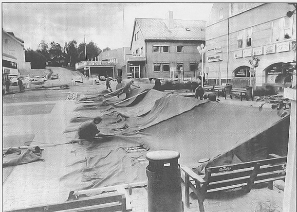
TOK INGEN SJANSER: Kongekomiteen i Lenvik valgte å ikke regne med sol. Mandag ettermiddag ble torgtelt som skal forhindre at det regner på konge, dronning og kronprins under kongekonsjen.