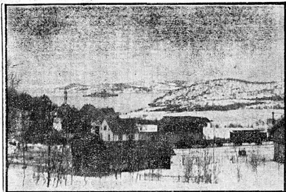
Klokken 15.30 den 13. april 1940. Fire tyske jagere har rømt inn i Rombak, etterfulgt av en rekke engelske jagere. Sist kommer

skyttelse. Denne feil i programmet vakte bestyrtelse. Engledderne kunne derfor nøyaktig 24 timer etter, uhindret gå inn Ofotfjorden med 4 destroyere og angriper tyskerne (det første sjøslag kl. 5 den 10. april). I dette slag ble tre tyske krigsskip senket pluss en del handelsskip. Den tyske destroyer «Erick Koelner» ble skadet og da den var manøvreredyktig ble den plassert utenfor Tjelle i Ofoten for å dekke flåteavdelingen ved Narvik med sine kanoner.