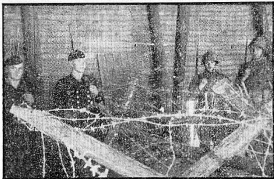
I riksgrenseøve: bygget på Ofotfjorden. Svensk og tysk vakt er etablert i april 1940. Svensk til høyre og tyske til venstre med