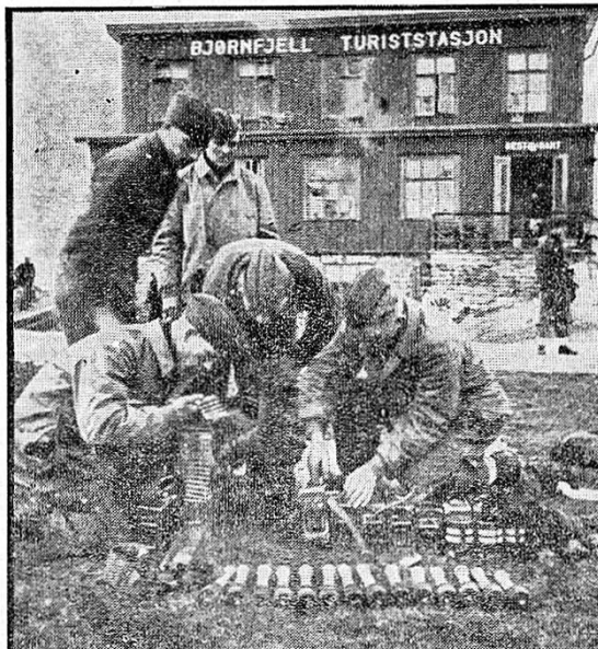
«Sanitetsmaterie!» pakkes ut under kampen i Bjørnefjellsavsnittet i midten av mai 1940.