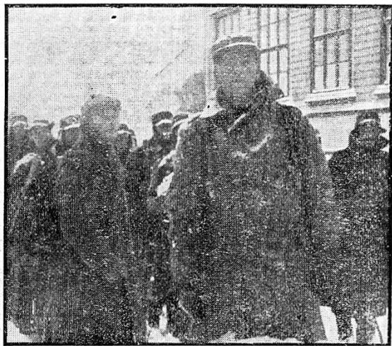
På formiddagen den 9. april 1940. Norske soldater av Nord-Tingdelags bataljon, som på mor-

Kl. 7 om morgenen den 9. april hadde tyskerne disponert sine krigsskip. Tre av dem gikk inn til Bjerkvik, og to patruljerte utenfor havna, to lå i slaglinje mellom den gamle